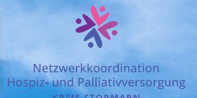
Netzwerkkoordination Hospiz- und Palliativversorgung KREIS STORMARN