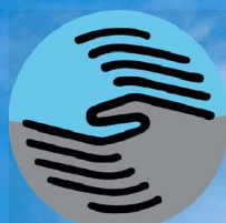
Betreuungsverein Stormarn e.V.