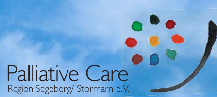
Palliative Care Region Segeberg/ Stormarn e.V.